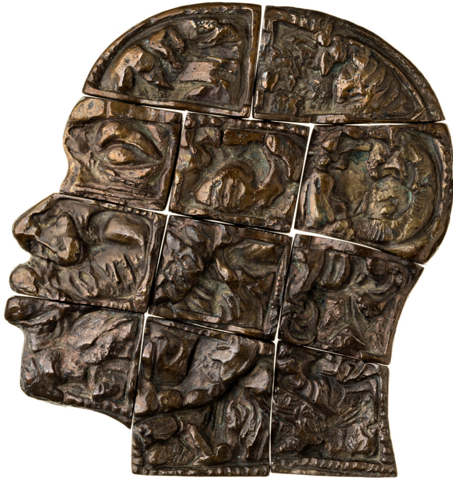
7 Rossen Andreev: Anton Wilhelm Amo, 2023, Bronze, 3477,24 g, 190x210 mm, Acc. 2023/31, Objektnummer 18310067. Ankauf direkt vom Künstler.