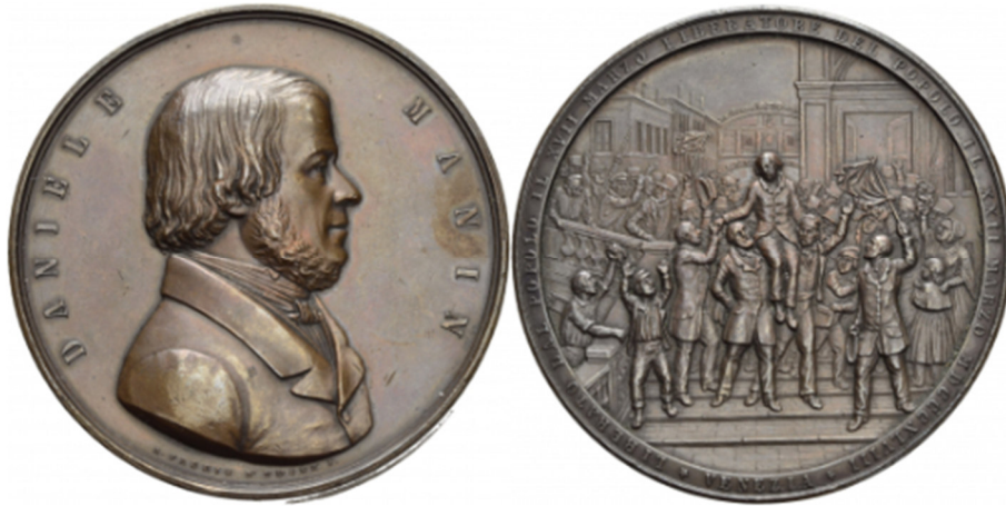
5 Antonio Fabris: Medaille auf den Juristen Daniele Manin, der an der Revolution in Venedig maßgeblich beteiligt war und später zum Ministerpräsidenten der Repubblica di San Marco ernannt wurde, 1848, Bronze, 105,85 g, 58 mm, Geschenk aus der Sammlung „Thomas Würtenberger – Ius in nummis“, Nr. 1466, Acc. 2023/48, Objektnummer 18292136.