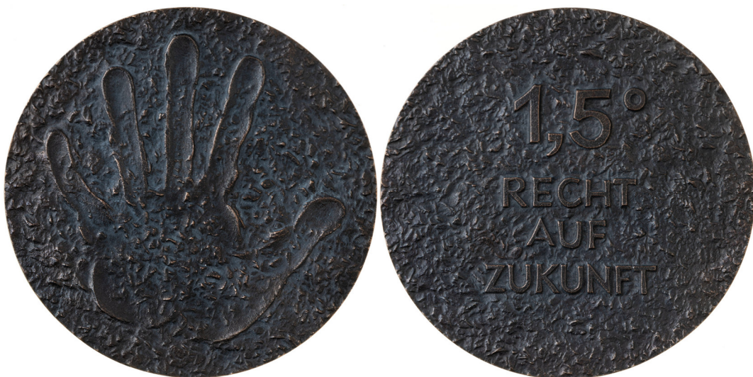
8 Marianne Dietz: 1,5° Recht auf Zukunft, 2023, 82 mm, Acc. 2023/33, Objektnummer 18304291, Schenkung der Numismatischen Gesellschaft zu Berlin, zuvor erworben aus Spendenmitteln der Familie Würtenberger für die Ergänzung des Bestands der Sammlung „Thomas Würtenberger – lus in nummis“, dort Nr. 3101.