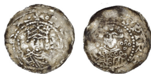
3 Speyer: Bistum, Denar (Dünnpfennig), ca. 1065–1075, Silber, 0,83 g, 18 mm, Acc. 2023/44, Objekt Nummer 18310519. Erworben aus Mitteln der Stiftung Haub.

Weitere Geschenke werden dem Bundesfinanzministerium, Dr. Karsten Dahmen, Kathrin Fahron, Karsten Förtsch, der Gesellschaft für Internationale Geldgeschichte, Helga Haub, dem Münz- und Auktionshaus Höhn, dem Kunstmuseum Moritzburg, der Numismatischen Gesellschaft zu Berlin, Manfred Olding, Dominik Ortner, dem Nachlass Eckhard Plümacher, Lars-Gunter Schier und Christian Stoess verdankt.