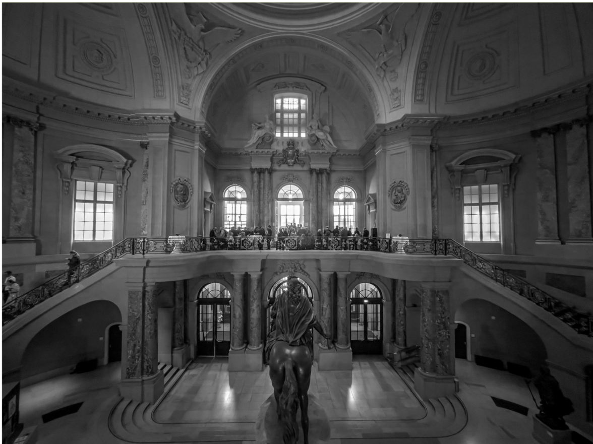
14 Ansicht des Eröffnungsempfangs in der Großen Kuppel des Bode-Museums am 25. Mai 2023.