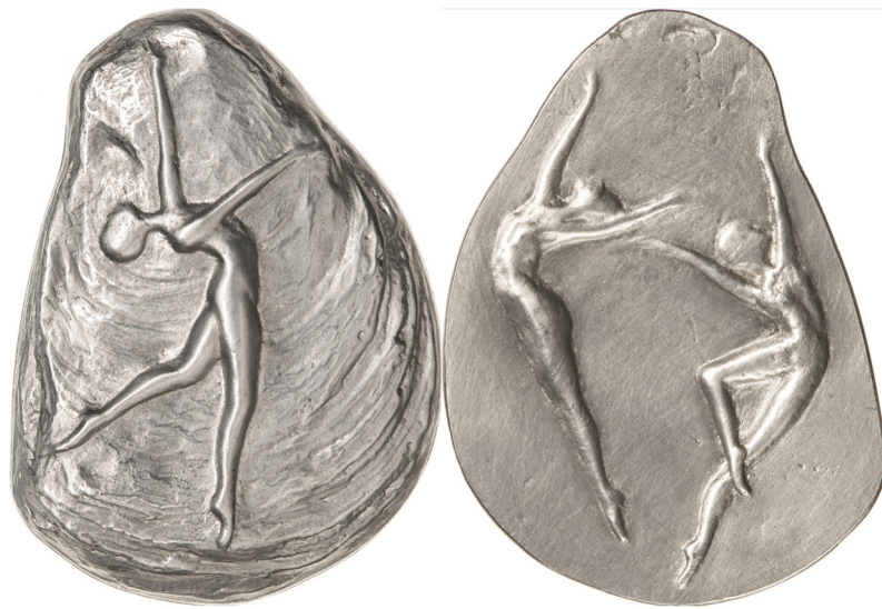
9 Finja Stöck: Drei Tänzerinnen, 2020, Weißmetall, 136,79 g, 51x71 mm, Acc. 2023/9, Objektnummer 18305241. Ankauf direkt von der Künstlerin.