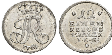
4 Preußen: Friedrich II., 1/12 Taler 1746, Silber, Münzstätte Esens, 3,32 g, 24 mm, Acc. 2023/7, Objektnummer 18303934. Geschenk von Helga Haub.